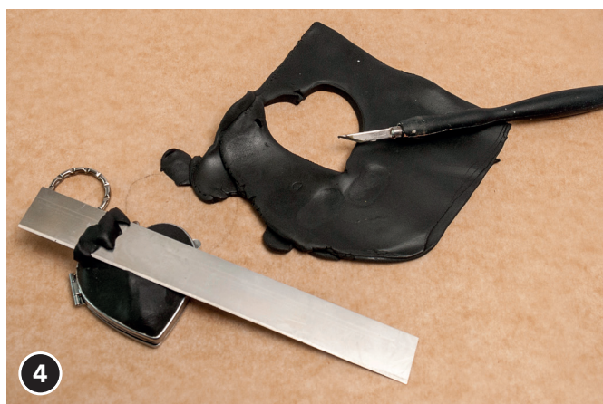
4 Appoggiare il cuore modellato sulla superficie approfondita dello specchio cuore. Premere la sostanza per modellaggio, tagliare la massa sporgente (sul bordo) con il taglierino Fimo.