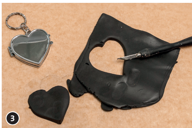
3 Prelevare il cuore dalla sostanza per modellaggio.