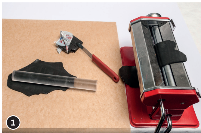
1 Impastare con le mani la sostanza per modellaggio a temperatura ambiente. Stendere una piastra di ca. 2 - 3 mm di spessore con il rullo modellatore (oppure con l'impastatrice).